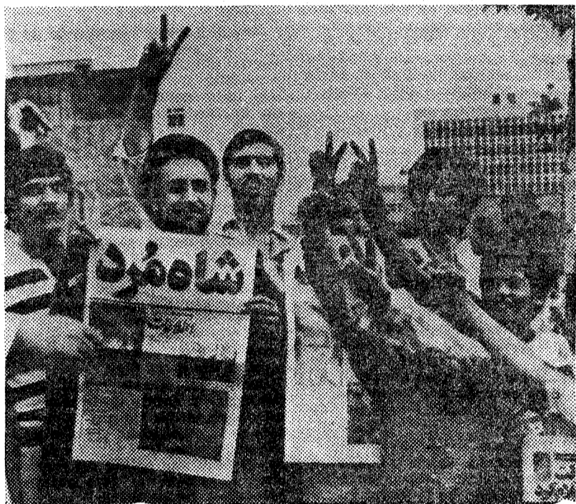
Al conocerse en Teherán el fallecimiento del ex emperador, se lanzaron a las calles de la capital gentes de todas las edades para mostrar su contento. En el grabado puede verse a chicos, jóvenes y mayores mostrando periódicos en los que aparece la para ellos fausta noticia.

A las 9.50 de la mañana del domingo, en una habitación del Hospital Maadi de El Cairo, falleció Mohamed Reza Pahlevi, desterrado Sha del Irán, rodeado de su familia. El ex monarca había perdido la batalla contra el cáncer, a pesar de los cuidados intensivos que recibió en los últimos meses. La muerte se produjo tras declararse al enfermo una hemorragia, cuando se estaba recuperando de una infección en el páncreas. El Sha se estaba tratando de un cáncer linfático por espacio de seis años, aunque la enfermedad fue ocultada celosamente en el tiempo de sus años de poder en Irán.